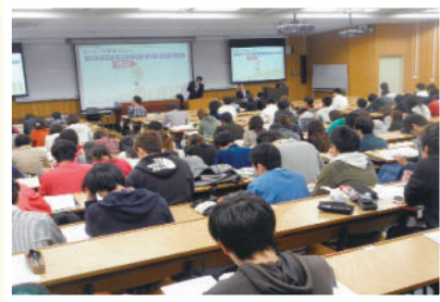
信州大学経法学部「経営者と企業」