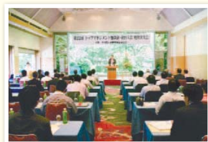
トップマネジメント懇談会「軽井沢・会員大会」

定時総会、委員会、支部活動など、当協会の会員を対象とした各種事業活動を毎月開催しています。懇親会等を通じて長野県知事、県内有力企業の経営トップをはじめ、幅広い層での業種を超えた交流の場を設けています。