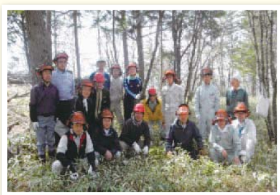
ビジネスリーダー育成をめざすワークショップ

先進企業の経営者・各界のリーダー・専門家等を講師とする各種講演会やテーマ別・部門別・階層別セミナーを開催しています。また、通信教育講座の受講、産業教育ビデオの利用、県内企業・団体の社内史・社内報の閲覧、青少年の健全育成を主眼とする出前授業の開講等、人材育成や能力開発をサポートしています。