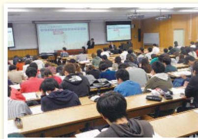
信州大学経済学部「社会科学特別講座」